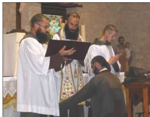
La remise de la bure capucine