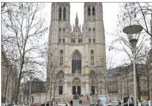
Outre les offices quotidiens et dominicaux, c'est en cet édifice que sont célébrés les mariages et les funérailles des membres de la famille royale belge.

En cette année 2017, la large famille protestante jette un regard en arrière, fait le point et regarde les défis qui se posent à elle pour aujourd'hui et pour demain. 1517- 2017 : 500 années d'existence pour l'Église protes-