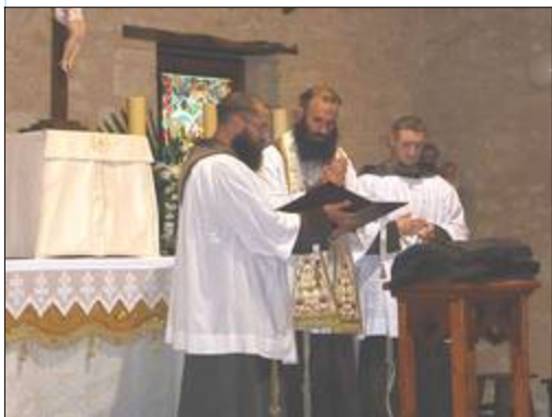
La bénédiction des bures et des cordes