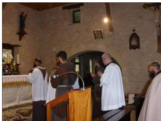
Les deux nouveaux novices