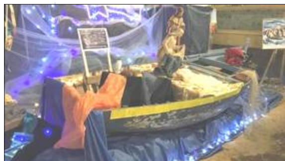
Crèche de Palerme

de l'Oratoire séculaire de saint Philippe Néri qui ont réalisé cette crèche sans Jésus. Ne parlons pas de toutes les crèches politiquement correctes où l'Enfant Jésus est représenté par un poupon noir, symbole, là aussi, des migrants. Comme à