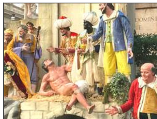
Crèche de la place Saint-Pierre au Vatican