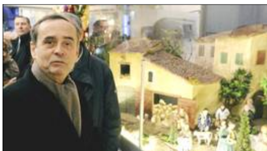
Robert Ménard, maire de Béziers