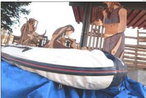
Hommage aux migrants à Castenaso: la crèche dans un canot pneumatique

A Castenaso , le maire ( de gauche ) a placé Joseph, Marie et l'Enfant Jésus dans une embarcation à deux sous : c'est la « crèche des migrants ». Le message est clair : les