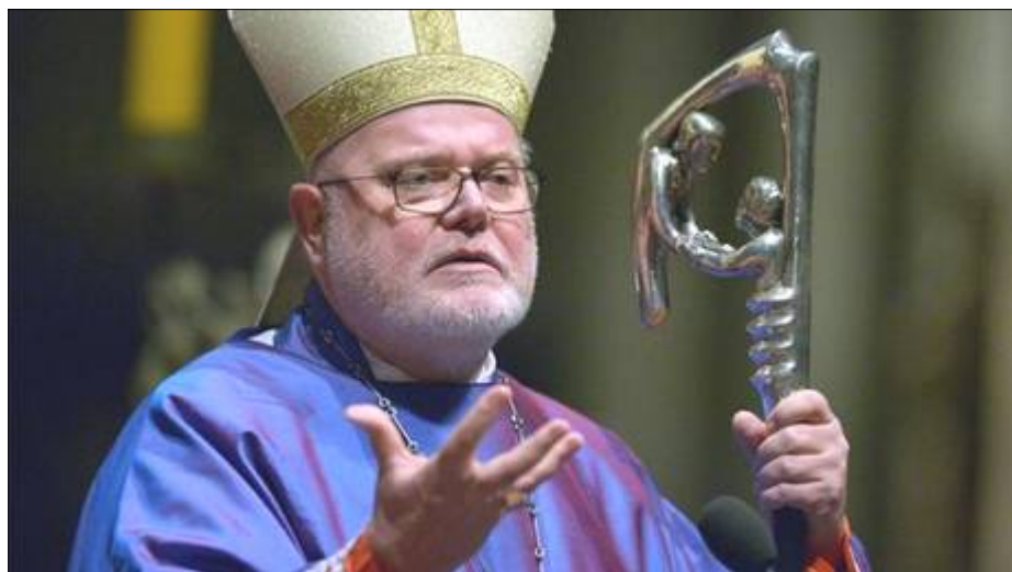
Cardinal Reinhard Marx, archevêque de Munich et président de la Conférence épiscopale allemande.

« Marx a en outre annoncé, est-il écrit dans le quotidien, que les évêques seront bientôt informés d'une proposition liturgique pour traiter avec des couples mixtes (catholique-protestant) qui veulent recevoir la communion ensemble. C'était déjà un projet du Conseil pour les Affaires religieuses et de la Commission œcuménique de la Conférence épiscopale [...]. Il a dit : « J'espère que nous pouvons faire un