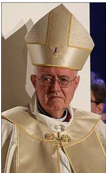
Mgr Cesare Nosiglia

20 février 2018 - Les fleurs du mal d' Amoris laetitia n'en finissent plus de s'ouvrir sous le soleil ténébreux de la dictature du relativisme, qui règne en monarque absolu sur la Rome néo-moderniste et post-concile.