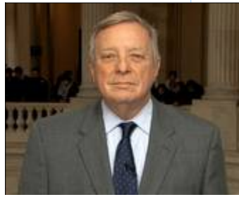
Dick Durbin, sénateur