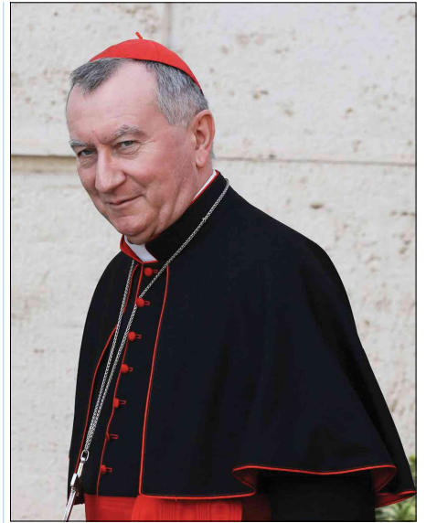
Cardinal Pietro Parolin, secrétaire d'Etat du Vatican

aux électeurs anti-système et anti-immigration, « à l'attitude négative », de Meloni donc ou de Salvini, les bêtes noires des évêques italiens.