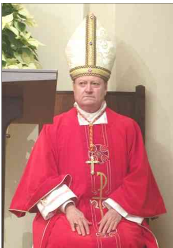
Cardinal Gianfranco Ravasi, président des Conseils pontificaux pour la culture, l'archéologie sacrée et le patrimoine culturel de l'Église.

Aujourd'hui, c'est le cardinal Ravasi, président du Conseil pontifical pour la Culture, qui exprime sa pensée sur le quotidien italien Il Giornale . Une pensée résolument hostile à ce qu'il nomme « les populismes », terme méprisant pour désigner les doctrines nationalistes et identitaires. « Le problème des formes du populisme qui traverse presque toute l'Europe est certainement un mouvement social très complexe et en beaucoup d'aspects vraiment dramatique, parce que cela représente surtout le rejet. Une peur qui cependant ne doit pas être enjambée mais éventuellement gouvernée et en beaucoup d'aspects dépassée », a-t-il déclaré avant de formuler son adhésion à la vision pseudo-chrétienne et pseudo-biblique de l'accueil (b) du pape François : « Il ne faut pas céder à la peur. La vision chrétienne est celle de la rencontre entre les peuples, en cherchant le plus possible à faire prévaloir l'entrecroisement des cultures, des peuples et des diversités à l'intérieur de l'histoire. Les grandes migrations, à partir de la Bible elle-même écrite pas des