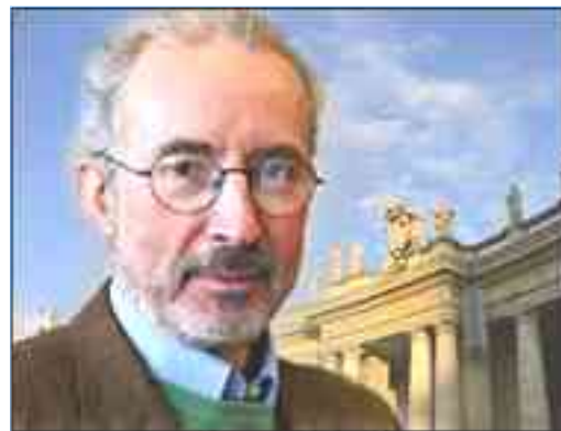
Sandro Magister Journaliste/Vaticaniste

Les documents cités sont téléchargeables à partir des liens suivants: